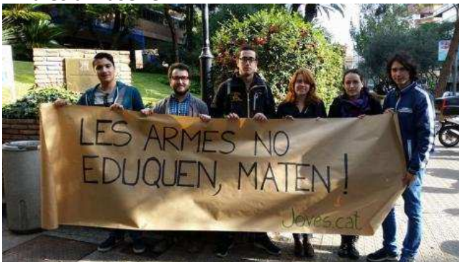
„Waffen bilden nicht, sie töten“. Eine Aktion im Rahmen der Woche gegen die Militarisierung der Jugend 2015 in Katalonien

Dieses neue Programm beschäftigt sich damit, wie weltweit junge Menschen dazu gebracht werden, Krieg und Militarismus als etwas Normales anzusehen.