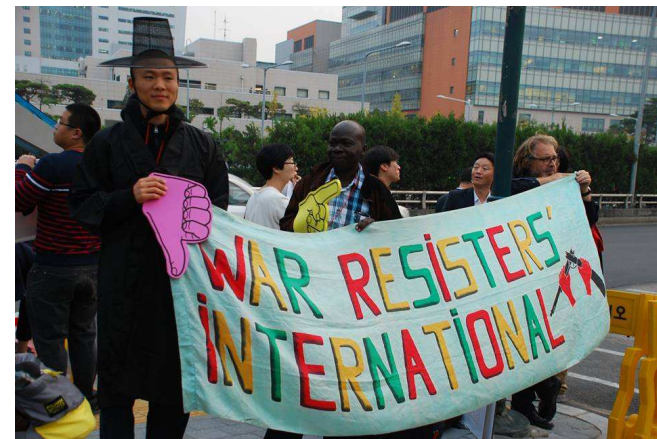
Protest in Seoul gegen die Waffenmesse ADEX, Oktober 2015

Unser Gewaltfreiheits-Programm verbindet Bewegungen miteinander, indem es gewaltfreie Instrumente für sozialen Wandel bekanntmacht und einsetzt. Zum Beispiel haben wir in den letzten Jahren regionale Trainings und Training auch für TrainerInnen in Lateinamerika, Afrika, Europa und Südkorea durchgeführt.